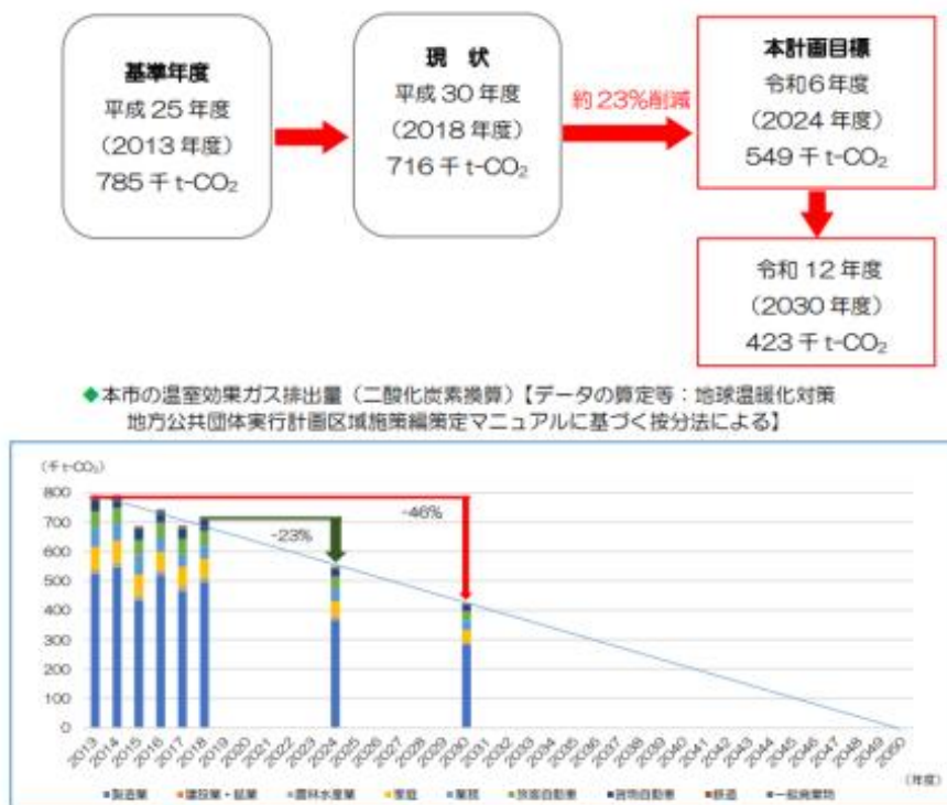
図 9 区域施策編の目標設定状況

2021 年度に策定した地球温暖化対策実行計画（区域施策編）は、計画期間を 4 年間として、2030 年度には 2013 年度比 46%削減を目標としており、「再生可能エネルギー利用の推進」を大きな取組みの方向性の 1 つに掲げている。