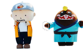
あんちゃん 北茨城市 観光ナビゲーター こうちゃん 北茨城市 イメージキャラクター