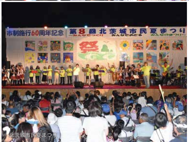
北茨城市民夏まつり