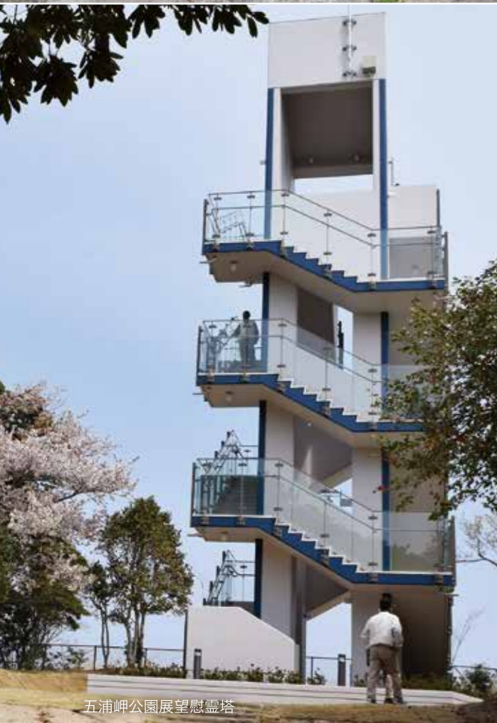
五浦岬公園展望慰霊塔