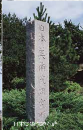
日本美術院跡石碑