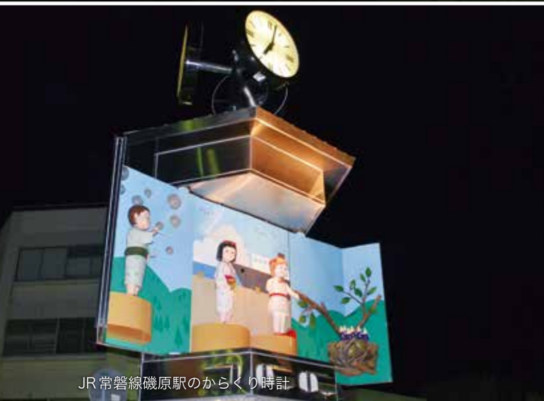
JR常磐線磯原駅のからくり時計