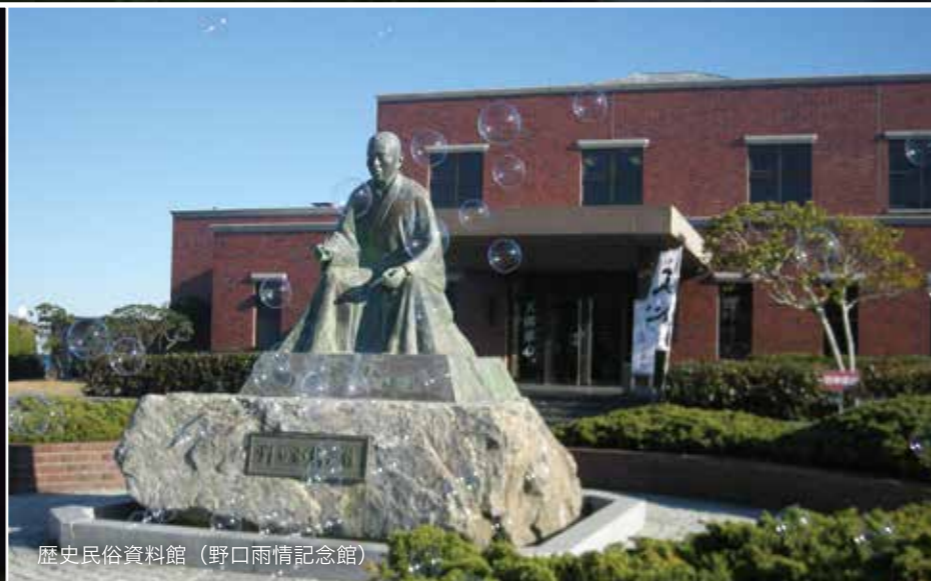
歴史民俗資料館（野口雨情記念館）