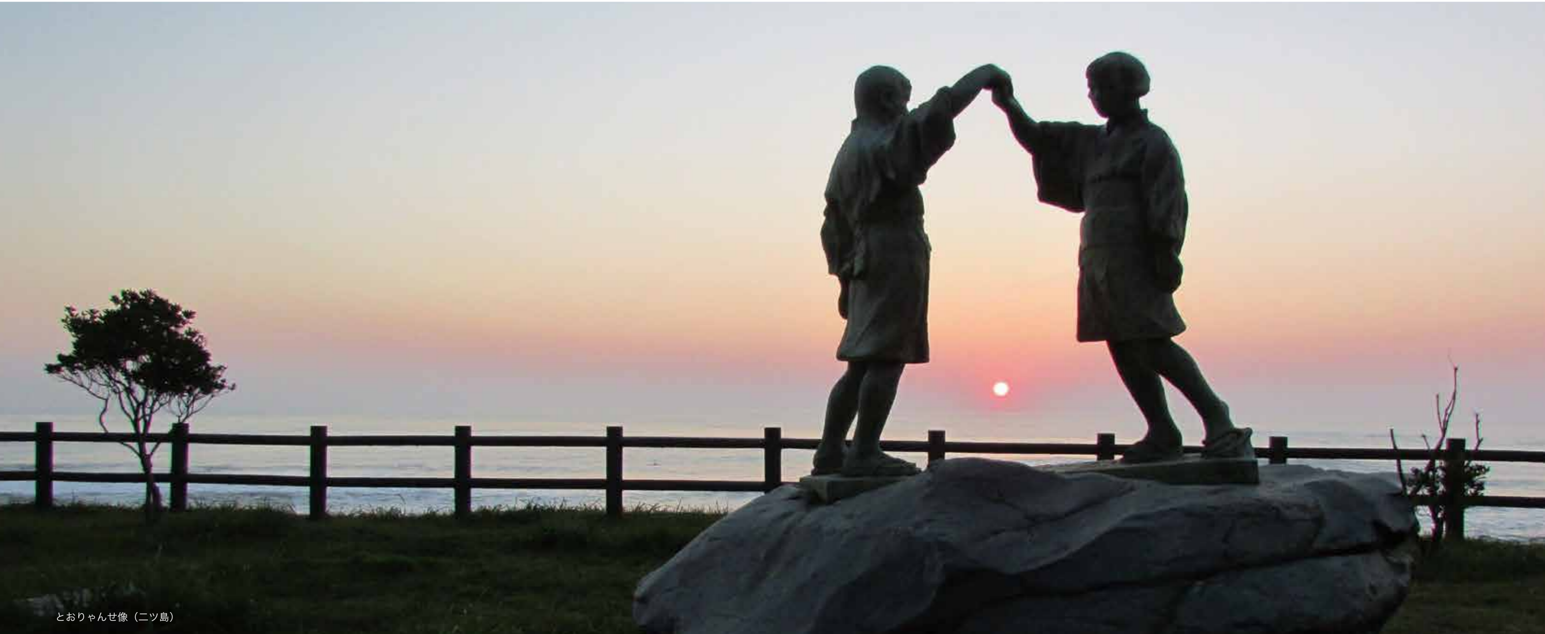
とおりゃんせ像（二ツ島）