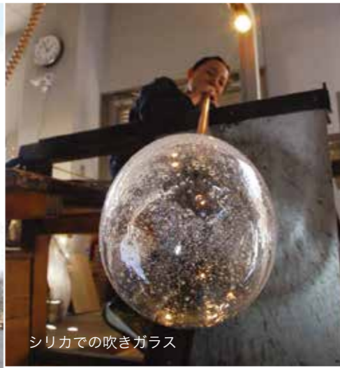
シリカでの吹きガラス