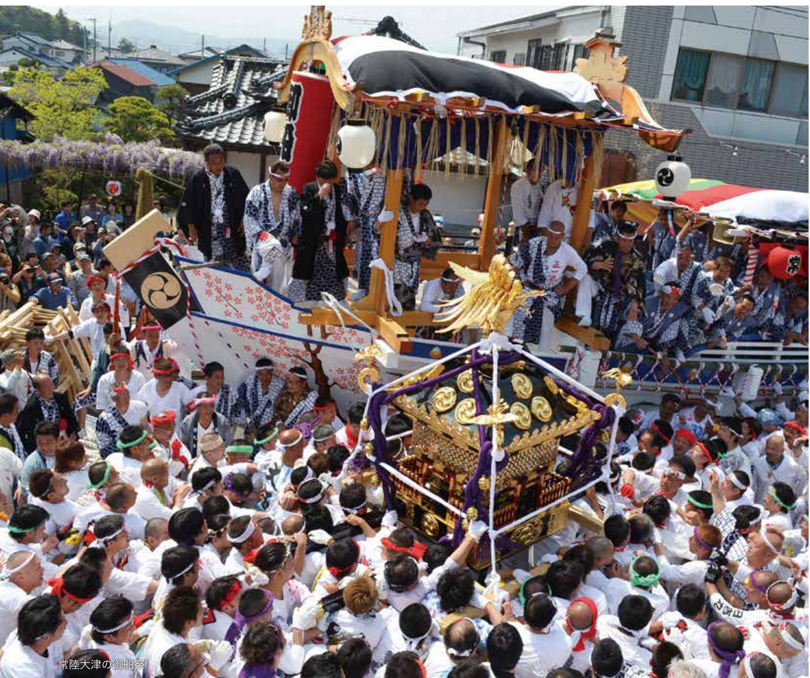
常陸大津の御船祭