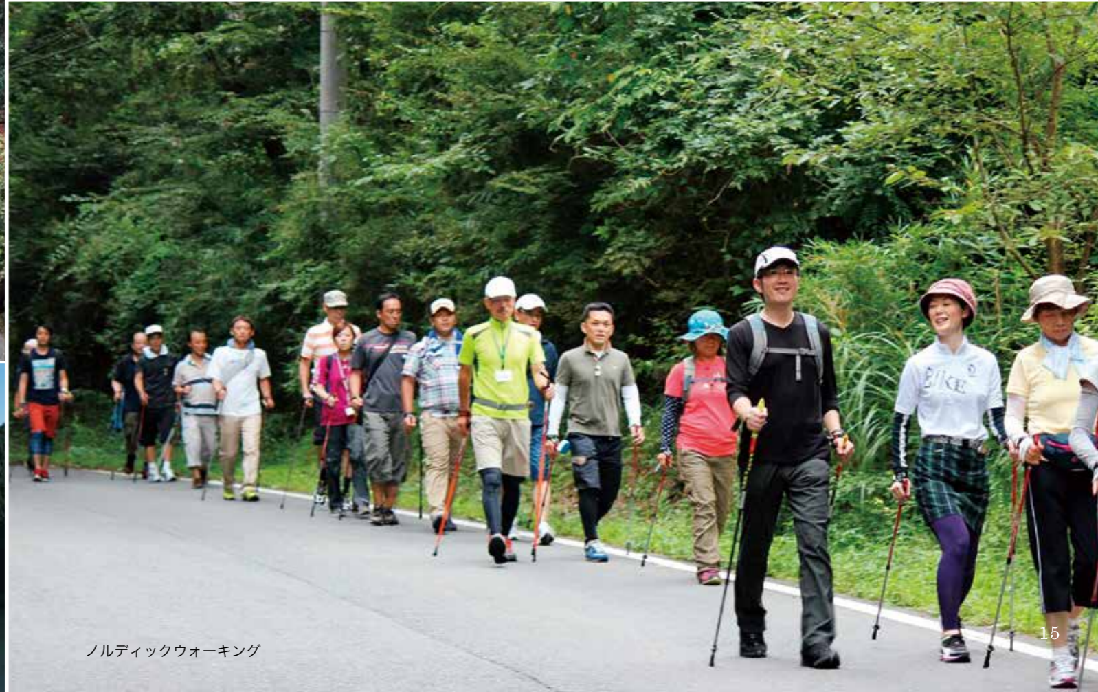
ノルディックウォーキング