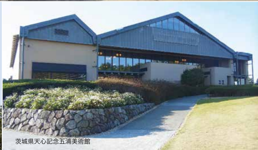
茨城県天心記念五浦美術館