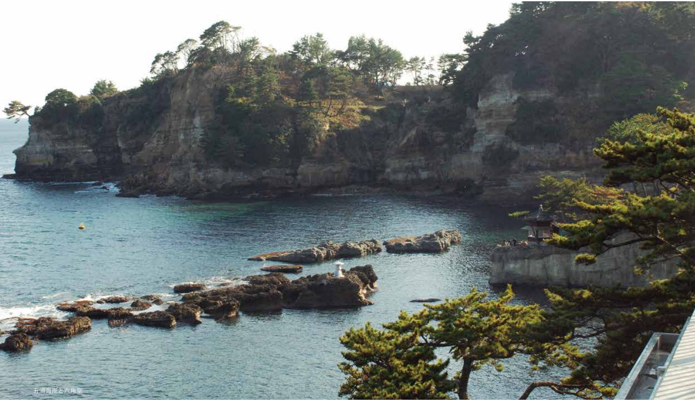
五浦海岸と六角堂