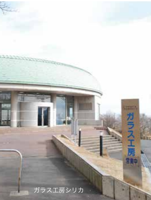
ガラス工房シリカ